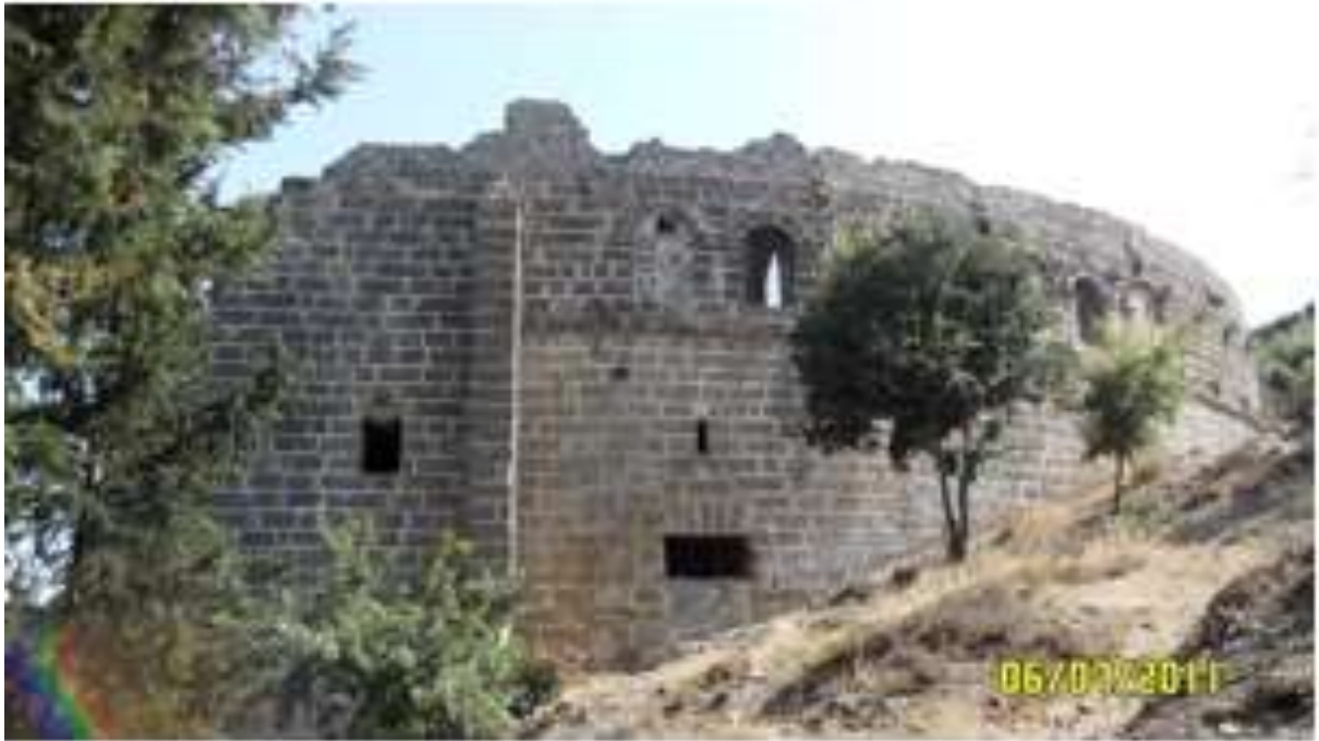
Seyirci Oturma Alanının Bulunduğu Yamaç